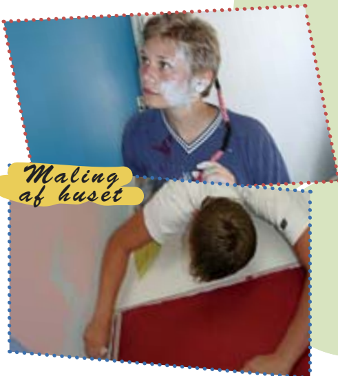
Maling af huset